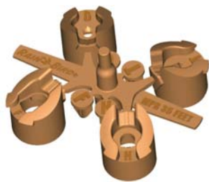
Мини-комплект на четыре форсунки

5000MPRMPK (арт: Y046MPK): упаковка, содержащая 30 комплектов форсунок 5000MPRMPK: 10 шт. 5000MPRMPK-25, 10 шт. 5000MPRMPK-30 и 10 шт. 5000MPRMPK-35