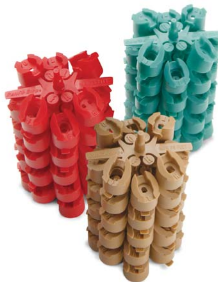
Форсунки MPR для роторов 5000 серии