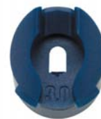
Форсунка Rain Curtain, вид спереди