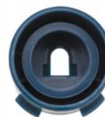
Форсунка Rain Curtain, вид сзади